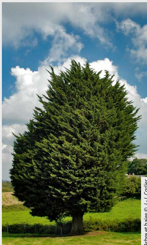
Arbre et haies

En savoir plus : www.capitale-biodiversite.fr