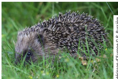
Hérisson d'Europe

■ Assurer la transparence des ouvrages hydrauliques pour la faune des rivières.