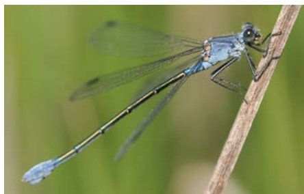
Leste à grands stigmas

■ Accompagner les exploitants agricoles vers une agriculture respectueuse de l'environnement à travers des aides et par la commande publique : transition vers toutes les formes d'agro-écologie, implantation de nouvelles exploitations, aménagements pour favoriser le retour de la faune sauvage dans les exploitations en tant qu'auxiliaire de culture.