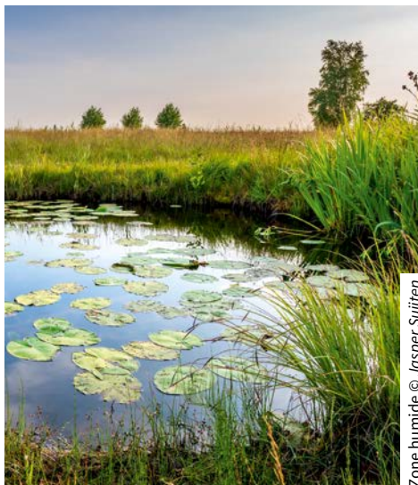
Zone humide

■ Mettre en œuvre efficacement la séquence Eviter-Réduire-Compenser pour chaque projet d'aménagement en donnant priorité à l'évitement.